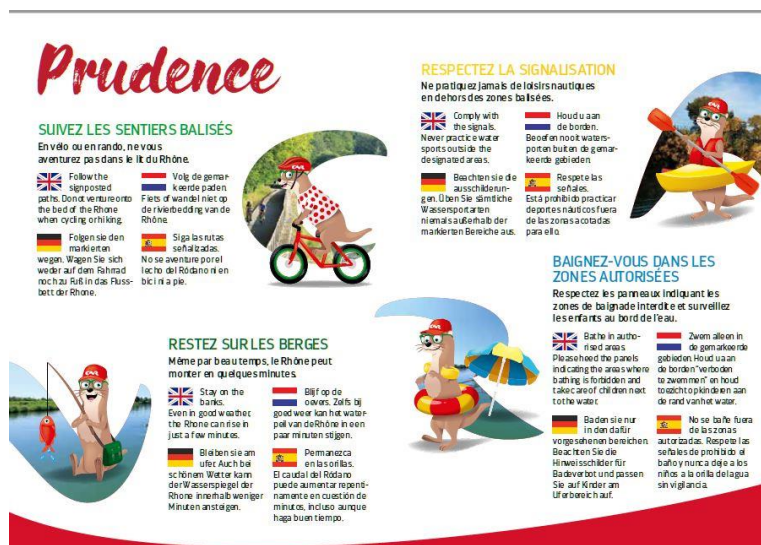
Un exemplaire du dépliant en cinq langues (français, espagnol, allemand, anglais, néerlandais) qui sera à disposition des usagers

Présente aux côtés des collectivités et associations pour soutenir leurs projets de développement, CNR les associe à son opération estivale : courrier et diffusion des supports de communication de la campagne auprès des grands prescripteurs (mairies, offices de tourisme) ; lettre d'information aux Préfets des régions et départements concernés.